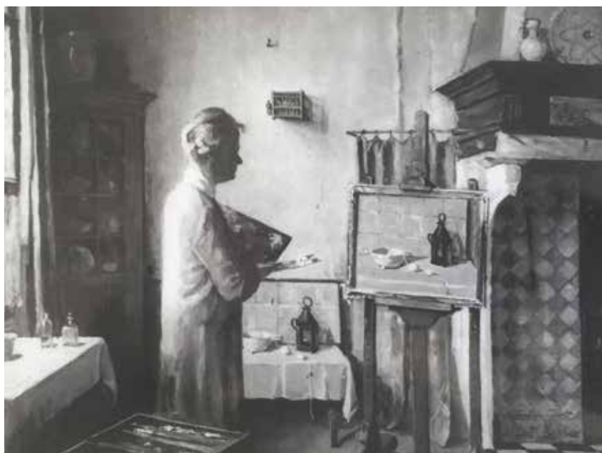
Zelfportret Lucie van Dam van Isselt (ca. 1935), helaas gestolen