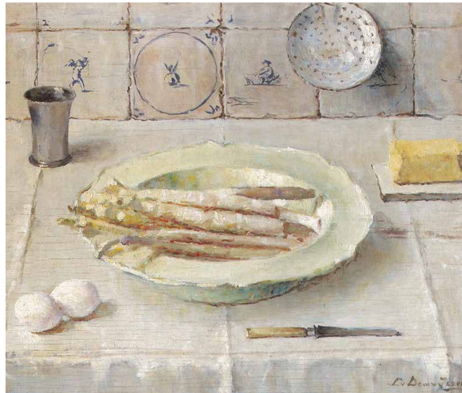
De Asperges (1944), particuliere collectie

TEKST GEMMA BOORMANS FOTOGRAFIE EVA PLEVIER (PORTRET KAREN EKKER)