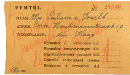
Het fiche van de Kulturkammer waarop met rood potlood staat geschreven: 'Vervalt. Wenschit geen lid te worden.'