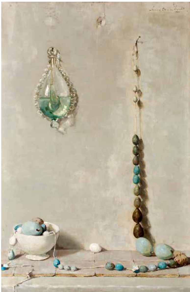
'Eiersnoer met stormglas', 1920, olieverf op paneel, 89 x 59 cm, part. coll.

Lucie van Dam van Isselt was begin vorige eeuw gerespecteerd lid van Haagse kunstenaarsverenigingen, maar verkoos het pittoreske stadje Veere, dat zij schilderde 'met een verfijning die tegen een stootje kon'.