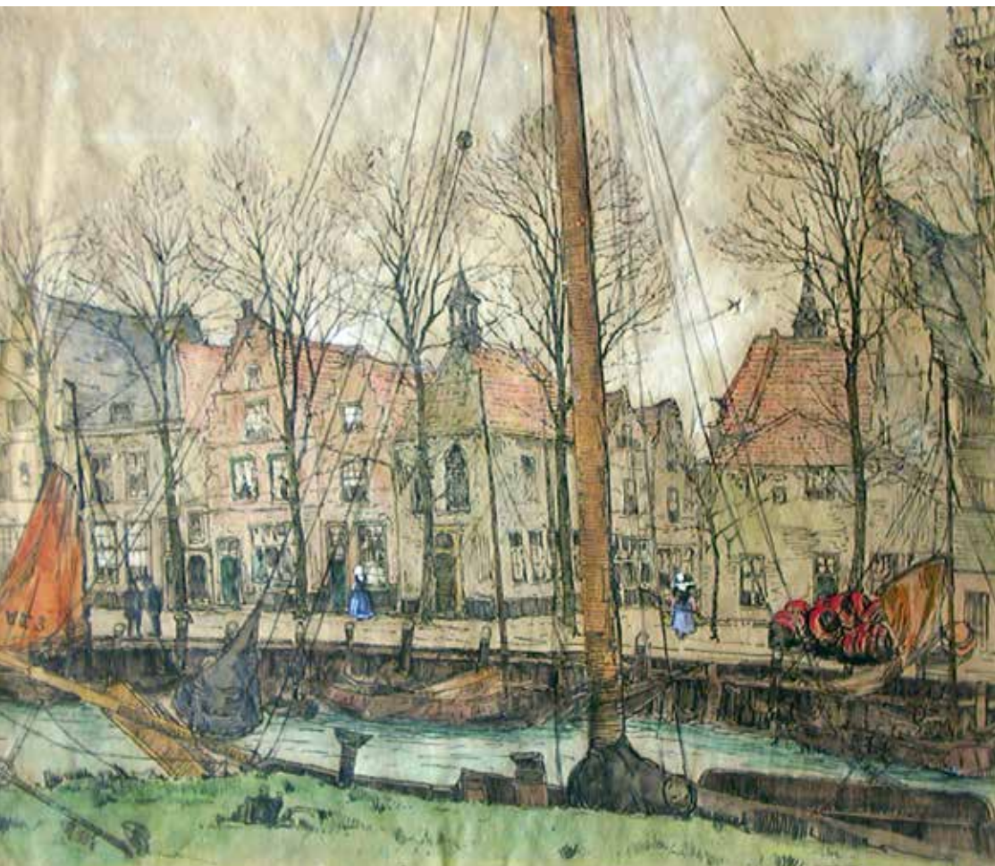
‘Kade in Veere’, 1930, aquarel, 31 x 36 cm, Museum Veere